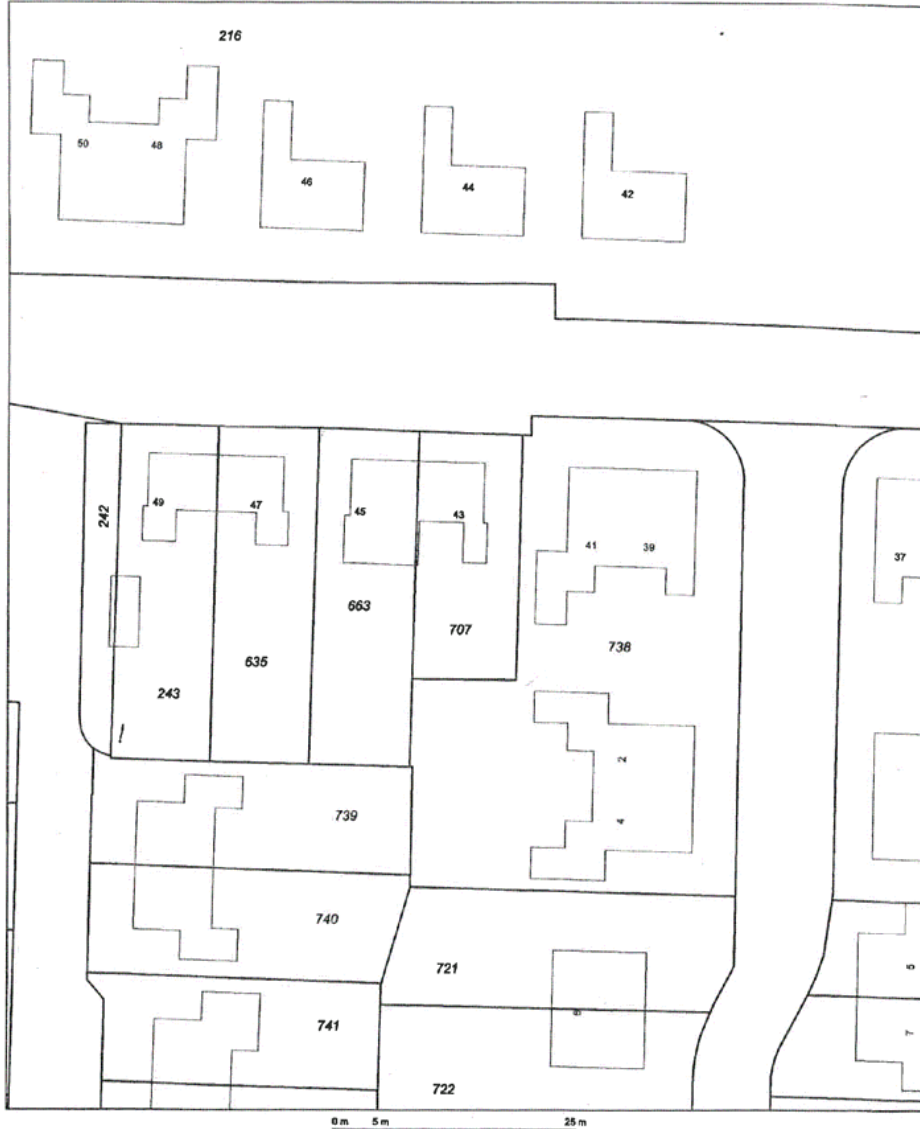
Uittreksel Kadastrale Kaart